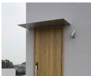
ステンレス庇ヘアライン